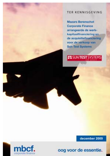
De tombstone van Sun Test Systems ter kennisgeving

Wilt u meer weten over deze specifieke opdracht of de activiteiten van mbcf. in deze sector, neem dan contact op met Jaap de Jong.